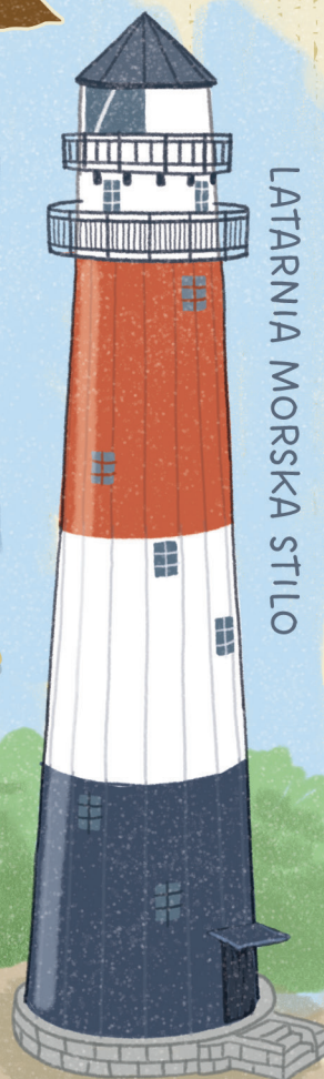
LATARNIA MORSKA STILO

Latarnie morskie wskazują drogę statkom.