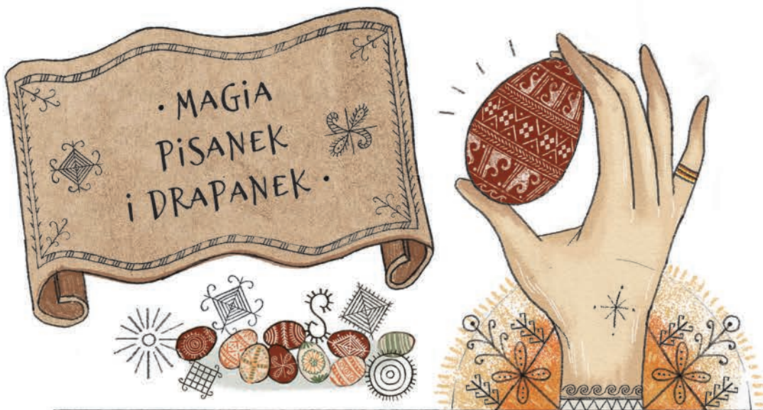
Toczono je po bokach bydła, by było zdrowe.