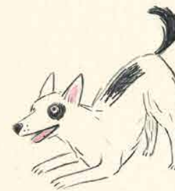
w nastroju do zabawy