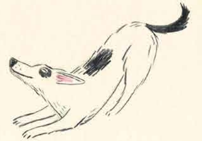
Cześć, kocham Cię!