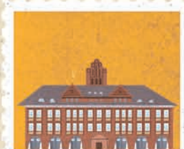
Koszalin str. 6-7