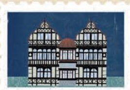
Toruń str. 12-13