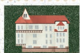
Katowice str. 28-29