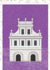
Sandomierz str. 46-47