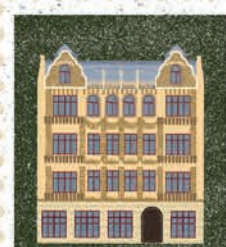
Łódź str. 42-43