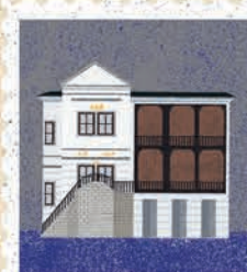
Sanok str. 62-63