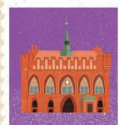
Malbork str. 10-11