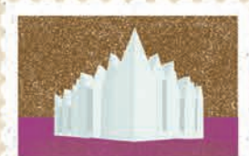
Szczecin str. 4-5