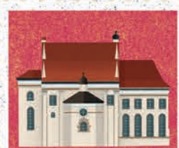
Kazimierz Dolny str. 52-53