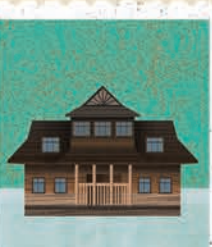
Zakopane str. 56-57