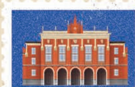
Kraków str. 54-55