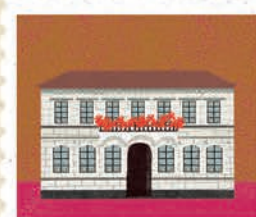
Gniezno str. 22-23