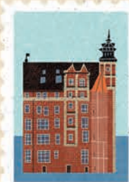
Gdańsk str. 8-9