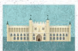
Lublin str. 48-49