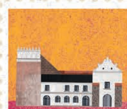
Przemyśl str. 60-61