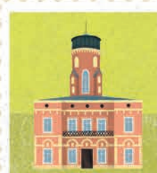
Częstochowa str. 32-33