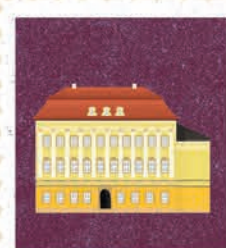
Wrocław str. 24-25