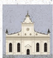
Zamość str. 50-51