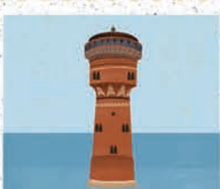
Giżycko str. 36-37