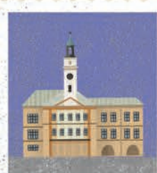
Cieszyn str. 30-31