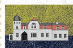
Olsztyn str. 34-35