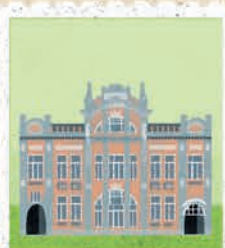
Białystok str. 38-39