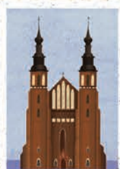
Opole str. 26-27