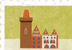
Poznań str. 20-21