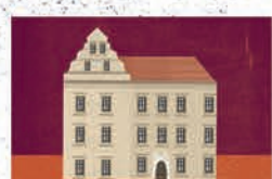
Zielona Góra str. 16-17