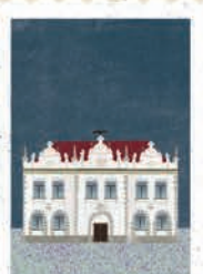
Rzeszów str. 58-59