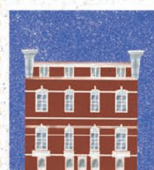
Gorzów Wielkopolski str. 18-19