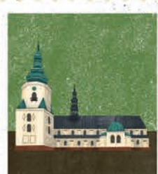
Kielce str. 44-45