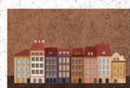
Warszawa str. 40-41