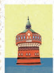
Bydgoszcz str. 14-15