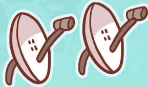
DWIE ANTENY SATELITARNE