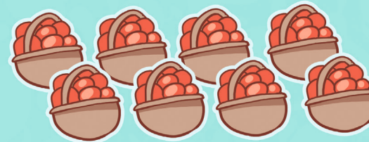
OŚMIEM KOSZY Z OWOCAMI