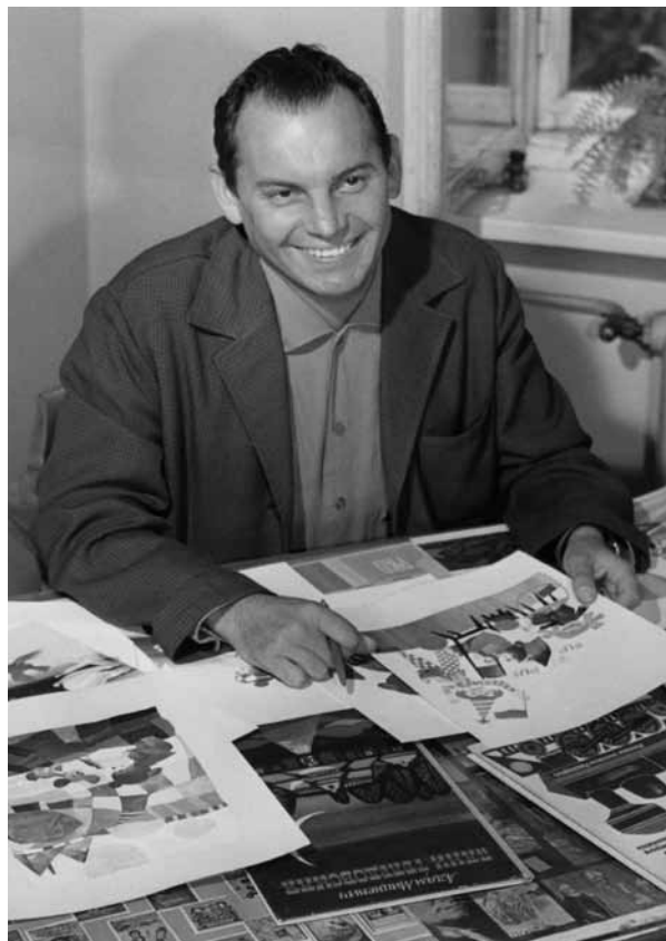
Zbigniew Rychlicki podczas pracy nad ilustracjami do przygód Misia Uszatka.

Już w 1954 roku otrzymał I nagrodę na Ogólnopolskiej Wystawie Książki i Ilustracji oraz Nagrodę Prezesa Rady Ministrów za twórczość dla dzieci i młodzieży. W następnych latach został obsypany nagrodami i wyróżnieniami krajowymi i międzynarodowymi. Najbardziej cenił sobie Nagrodę im. Hansa Christiana Andersena i Order Uśmiechu (1976). Prace prezentował na licznych wystawach indywidualnych i zbiorowych, m.in. w Amsterdamie, Ostendzie, Berlinie, Londynie, Pradze, Budapeszcie, Bolonii, Sofii, Wiedniu, Kairze, Hawanie, Bari, Hanoi, Mińsku, Pekinie, Bratysławie, Tokio. Zmarł w 1989 roku na XII Biennale Ilustracji w Bratysławie (od pierwszej edycji w 1967 roku zasiadał w Międzynarodowym Komitecie Organizacyjnym BIB i przez lata uczestniczył w jego pracach).