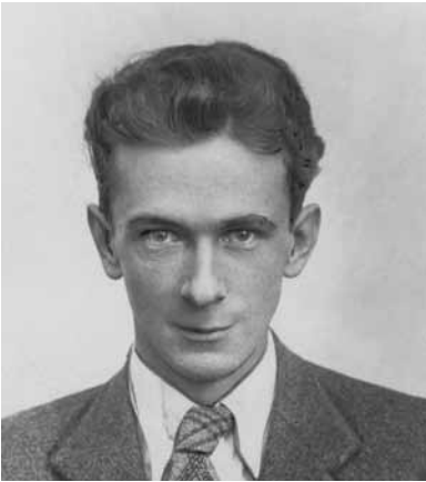
Czesław Janczarski, lata 30.

Miś Uszatek miał szczęście do swoich ojców: Czesława Janczarskiego oraz Zbigniewa Rychlickiego. Janczarski (pseudonim literacki Jan Antkiewicz) obdarzył go poetycką miękkością, czyniąc z niedźwiadka pogodną, rozczulająco naiwną postać. Nie może to dziwić tych, którzy pamiętają, że Czesław Janczarski był poetą (także prozaikiem, tłumaczem z języka rosyjskiego, dziennikarzem i nauczycielem).