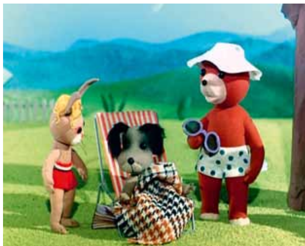
Fotosy z serialu o przygodach Misia Uszatka.